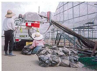
マルチ巻き上げ風景