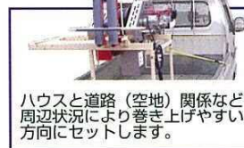
ハウスと道路(空地)関係など周辺状況により巻き上げやすい方向にセットします。