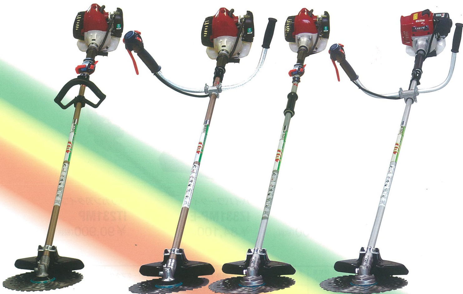
スタンダードタイプ IA231MP-R オープン価格