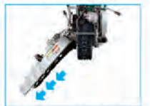
側面の刈幅が350~670mm まで4段階調整できます。