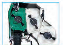
フリーナイフ仕様