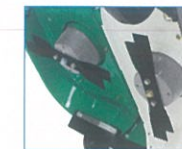
ダブルナイフ仕様