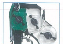
フリーナイフ仕様