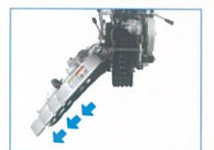
側面の刈幅が350~670mm まで4段階調整できます。