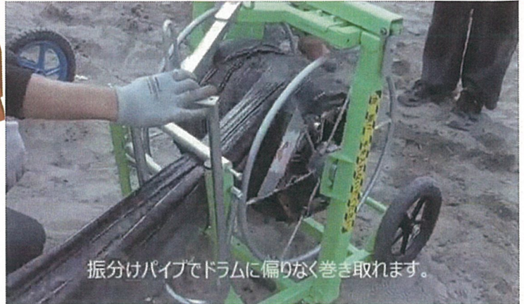
振分けパイプでドラムに偏りなく巻き取れます。