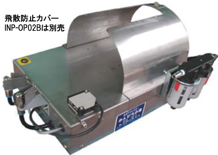
飛散防止カバー INP-OP02Bは別売